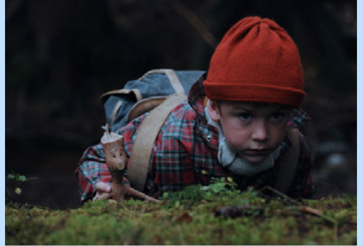
Pikkuveli ja Keppi kohtaavat hurjia seikkailuja.

Puukamu on ikärajan elokuva ja se sopii parhaiten perheen pienimmille. Tarinassa on lapsille sopivasti seikkailuja ja jännitystä, mutta myös hauskoja repliikkejä ja meneviä lauluja. Vanhemmassa katsojassa elokuva herättää väkisinkin hilpeyttä. Elokuvan juoni on yksinkertainen, mutta välillä sitä hämmäntävät turhan monet sivujuonet. Tapahtumia olisi voinut karsia