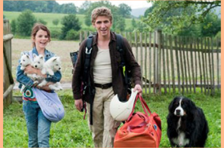
Laila ja Fred ovat todellisia eläinystäviä.

Heti alussa on helppo huomata, että elokuva on suunnattu lähinnä ala-asteikäisille. Elokuvan huumori on jokseenkin tökkivää ja lähinnä pieruihin perustuvaa, eikä siksi jaksaa naurattaa vähän kohdeyleisöä vanhempia. Kuitenkin elokuvassa paljon näkyvillä olevat koiranpennut herättävät pakosta-