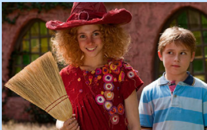
Noitatyttö Fuksialta ja Tommyltä eivät jekut lopu kesken.

NOITAMETSÄN FUKSIA ALANKOMAAT 2010, 88 MIN TI 22.11. KLO 15.00 KE 23.11. KLO 9.00 LA 26.11. KLO 10.00