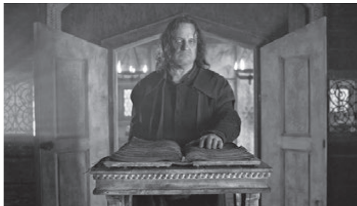
Mylläriellä on synkkiä salaisuuksia.

Esitykset: Plaza 5, ke 18.11, klo 13.00 pe 20.11, klo 17.00 la 21.11, klo 18.00