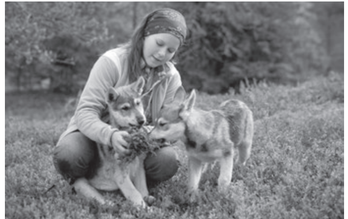
Salla on omapäinen luonnonystävä.

Esitykset: Valvesali, to 19.11. klo 13.00, VIITOTTU NÄYTÖS