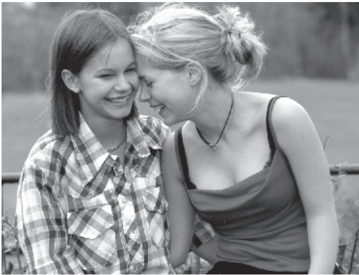
Elin ja Agnes on luotu selviämään.