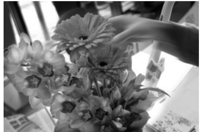
Onnea 25-vuotiaalle elokuvafestivaalille!

Haluatko mukaan? Seuraavan kerhon ohjelmistosta ja ilmoittautumisesta tulee tietoa Nukun Elokuvakoulun Internet-sivuille kevään aikana.