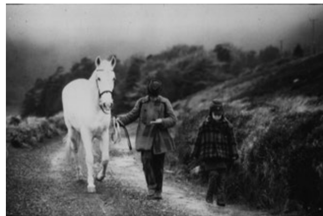
Ratsu mereltä -elokuvan katsoja saa nauttia henkeäsalpaavan kauniista maisemista.

Into the west Ohjaus: Mike Newell Iso-Britannia - Yhdysvallat 1992, 102min suomen- ja ruotsinkielinen tekstitys. YLI 9-VUOTIAILLE