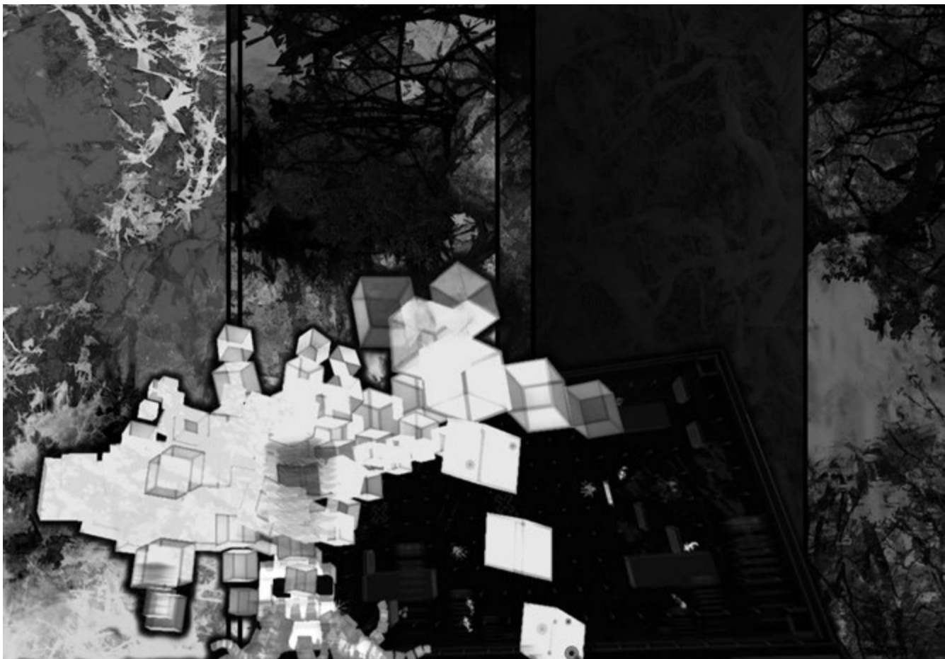
Pelejä voi pelata ruudulla, laudalla tai pelkän kuvittelun voimalla.