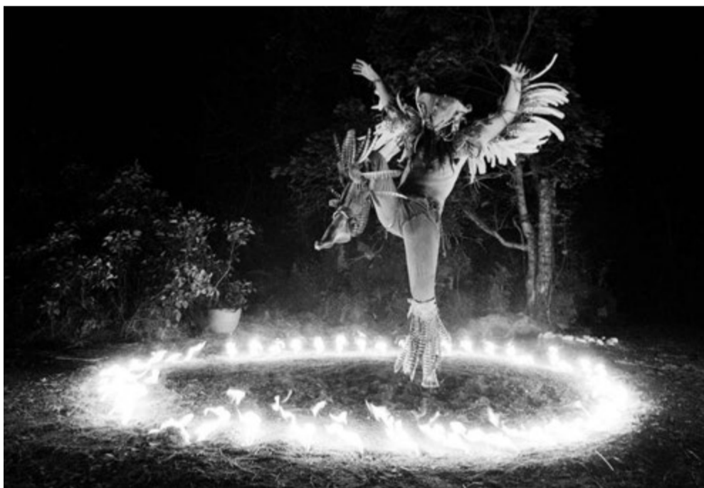
Nuukin shamaani-isä sadetanssin pauloissa.