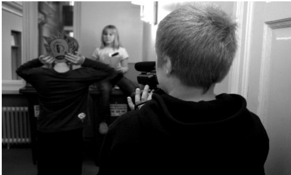
Elokuva tekeillä Nukun elokuvakoulun työpajassa.

Hyvän pop-kappaleen mitta on ohjeena lyhytelokuvissakin. Kolmeen - neljään minuuttiin mahtuu mainiosti kokonainen juoni käänteineen päivineen. Oskari-kilpailussa valitaan parhaat 24:sta lasten ja nuorten itse tuottamista lyhytelokuvista.