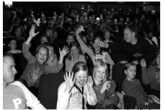
Lapsia ennen elokuvan alkua.

Nukun Sanataidekoulun 12-15-vuotiaiden ryhmä