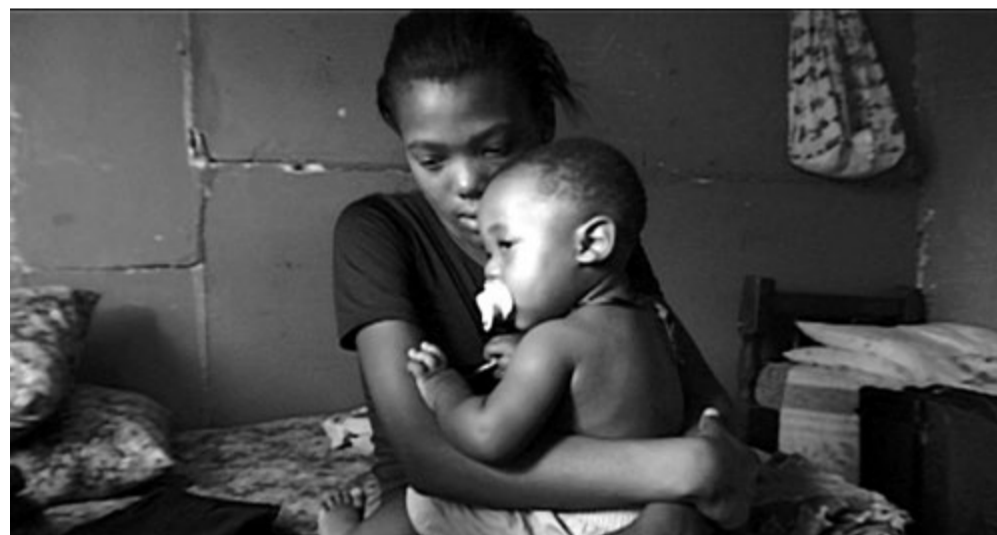
Äitien talo-elokuvan voit nähdä vielä lauantaina.

Elokuvasa Äitien Talo käydään läpi eteläafrikkalaisen naisen, Valencian, ja hänen lapsensa suhteita toisiinsa ja muihin ihmisiin. Tiellä on paljon ongelmia niin ihmisuhteissa kuin muissakin asioissa.