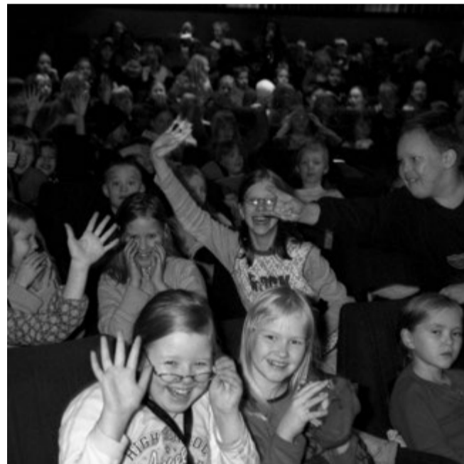
Festivaaliyleisöä ennen elokuvan alkua.

Elokuvateatteri Studion oven edusta suorastaan tulvii lapsia ja heidän vanhempiaan. Elokuvakerho Elinan syksyn viimeisen kokoontumisen on alkamaisillaan.