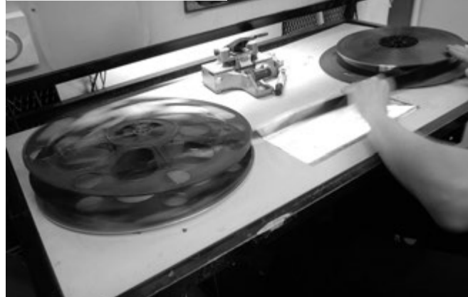
Filmit pitää kelata alkuun katsomisen jälkeen.