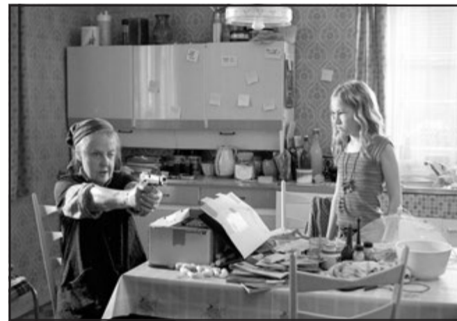
Villikanat-elokuva vielä tänään Riossa klo 18

Saksa 2005, 108 min, suomen- ja englanninkielinen tekstitys Alkuperäinen nimi: Die wilden Hühner SUOSITUS: YLI 9-VUOTIAILLE