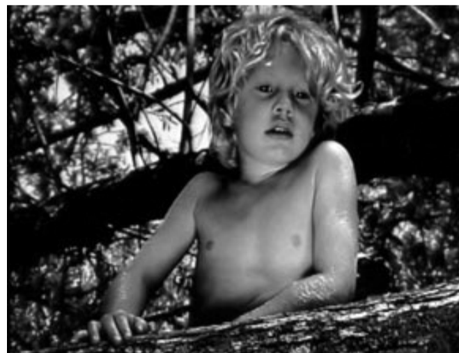
Eräänä kauniina aamuna -elokuvassa Sergei Prokofjevin musiikki vie unenomaisen mielikuvitukselliseen tunnelmaan.