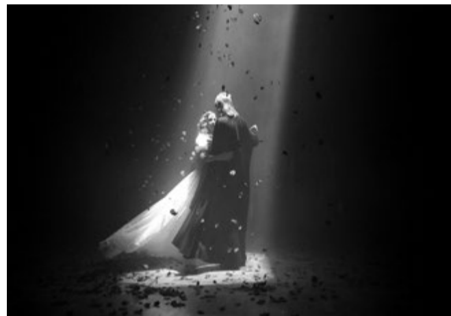
Paulan salaisuus palkittiin syyskuussa Frankfurtin festivaalilla