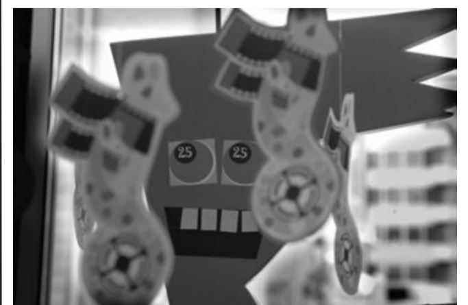
Festivaali-infon koristeluja Nukun aulassa.